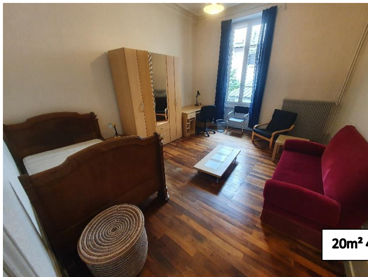
20m 2 490€