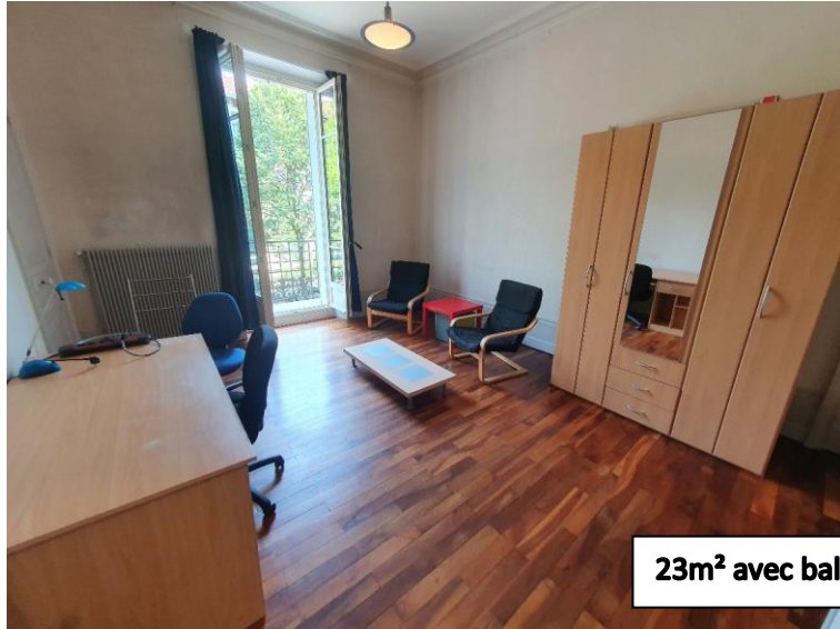
23m 2 avec balcon 535€

Les chambres sont composées d'un grand bureau avec chaise confortable, d'un lit, canapé, table basse et fauteuil détente, armoire, table de nuit et lampe. Possibilité de ramener vos propres meubles et stocker les autres dans le grenier.