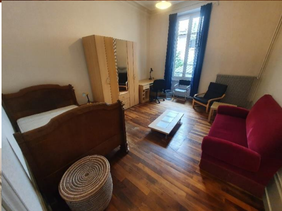
20m 2 460€