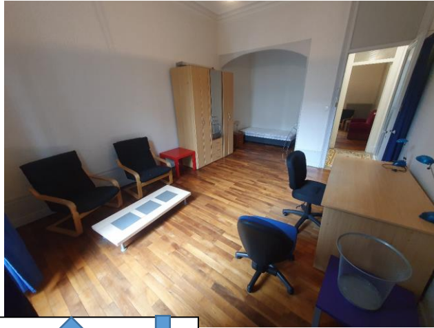
23m 2 avec balcon 500€ CH3 ↑ CH1 ↓